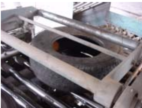
< -1 >